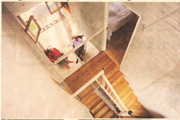
HÖGT I TAK. Huset får större rymd tack vare den öppna trappans slings murbocken.