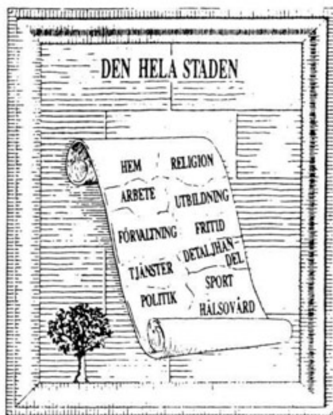
L Krier. En karikatyr av modern stadsplanering, som för varje år alltmer besannas av pågående stadsbyggnadspraxis. Vi har fått "bubbel-planering".

Varför byggs då inte sådana miljöer? Vad är det för tabu som hindrar byggare, planerare och politiker att producera det som efterfrågas?