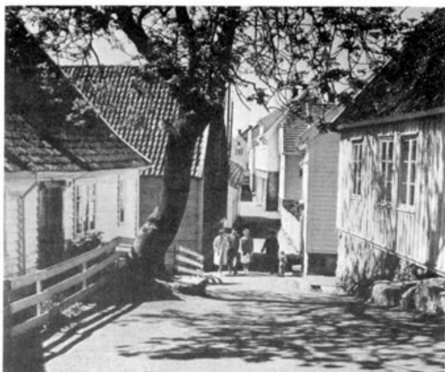
Skudeneshavn, fiskeläge. Byn och staden som scenografi, en förebild för dagens planerare.

Om en regel är bra, borde den för det mesta även kunna gälla retroaktivt. Applicerat på vårt stadsbyggande skulle strandskyddet dock med den logiken radera ut nästan alla våra stadsklenoder. Hjo, Riddarholmen, Trosa, Hudiksvall – allt weg! Landhöjningen ger en del städer intrycket av en husfri strandzon, men annars ligger städer och byar för det mesta just vid vatten. Vatten som hav, vik, damm, älv, kanal, bäck eller å. Den gamla vattenlinjen ger arkeologen tips om var han kan finna forntida bosättningar.