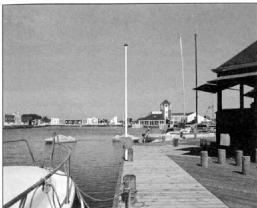
Ebentoft. Fritidsbebyggelse byggdes på torra land, sen släpptes vattnet på.

Vid sjönära projekt hör man hummande om strandskydd och ser pannor i bekymrade veck. En del hinder och invändningar som reses har uppdagat frågor som är värda en diskussion.